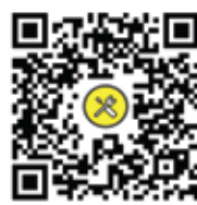
網上保用登記* Online Warranty*

#網上登記服務暫只適用於購自香港的電子門鎖及電子保險箱產品。 #Online registration is only suitable to Digital Door Lock and Digital Safe purchased in Hong Kong.